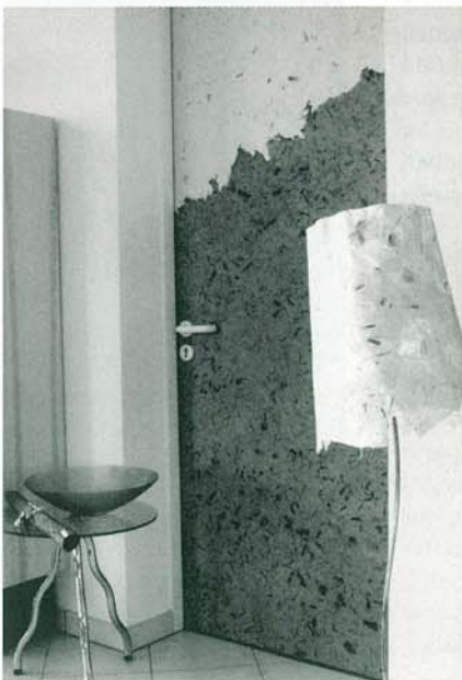
Tür-Kleid: Das homogene Papier passt sich jedem Untergrund an – ohne Nähte, Rapport und Verschnitt

Zimmerwände bekommen einen individuellen Touch durch Patch-Art, eine neuartige Kunst der Wandgestaltung. Es handelt sich hierbei nicht um Rollenware und es werden auch keine Bahnen verarbeitet.